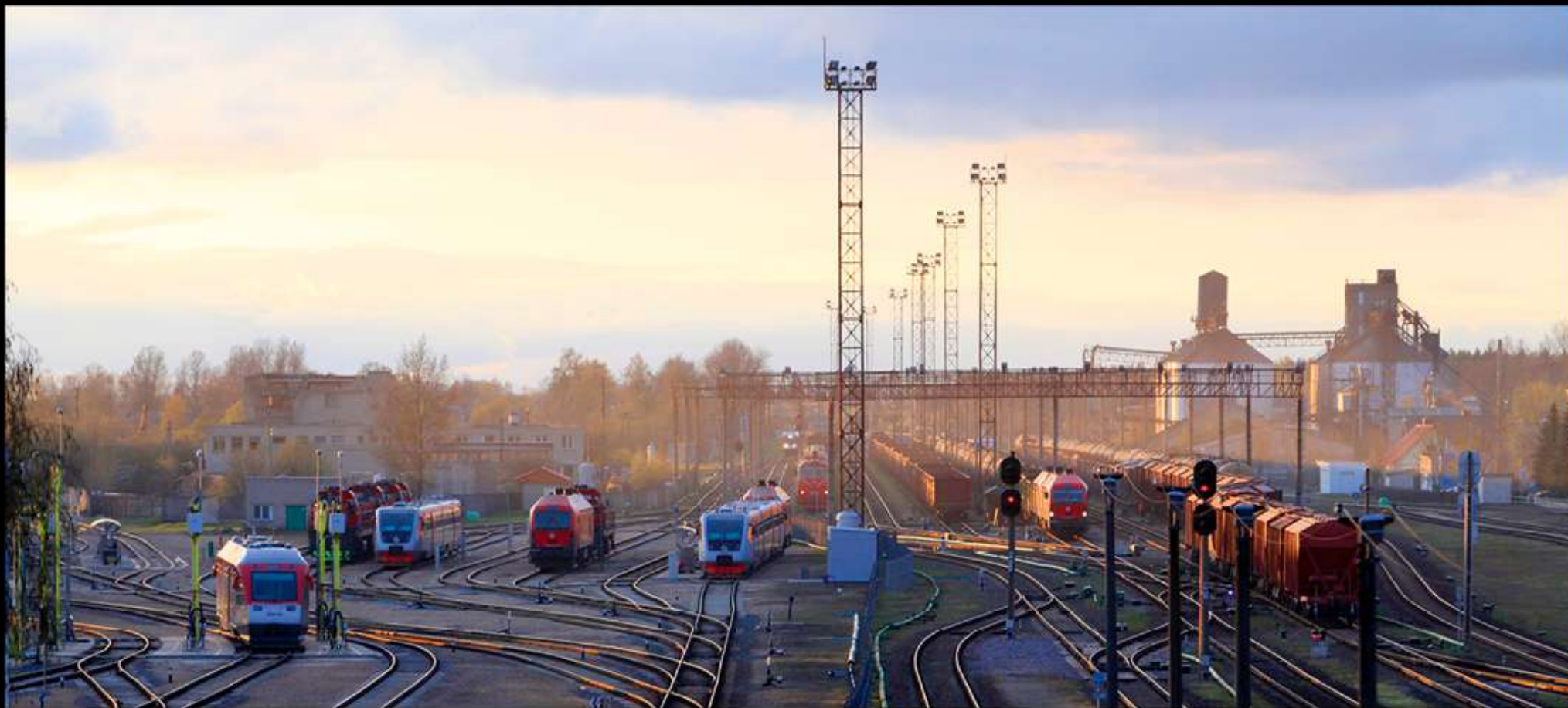
Radviliškis. Geležinkelis pagrįstai vadinamas miesto simboliu. Radviliškio geležinkelio mazgas – vienas svarbiausių Baltijos šalyse, čia šakojasi linijos į Maskvą, Rygą, Minską, Varšuvą, Kaliningrado sritį.