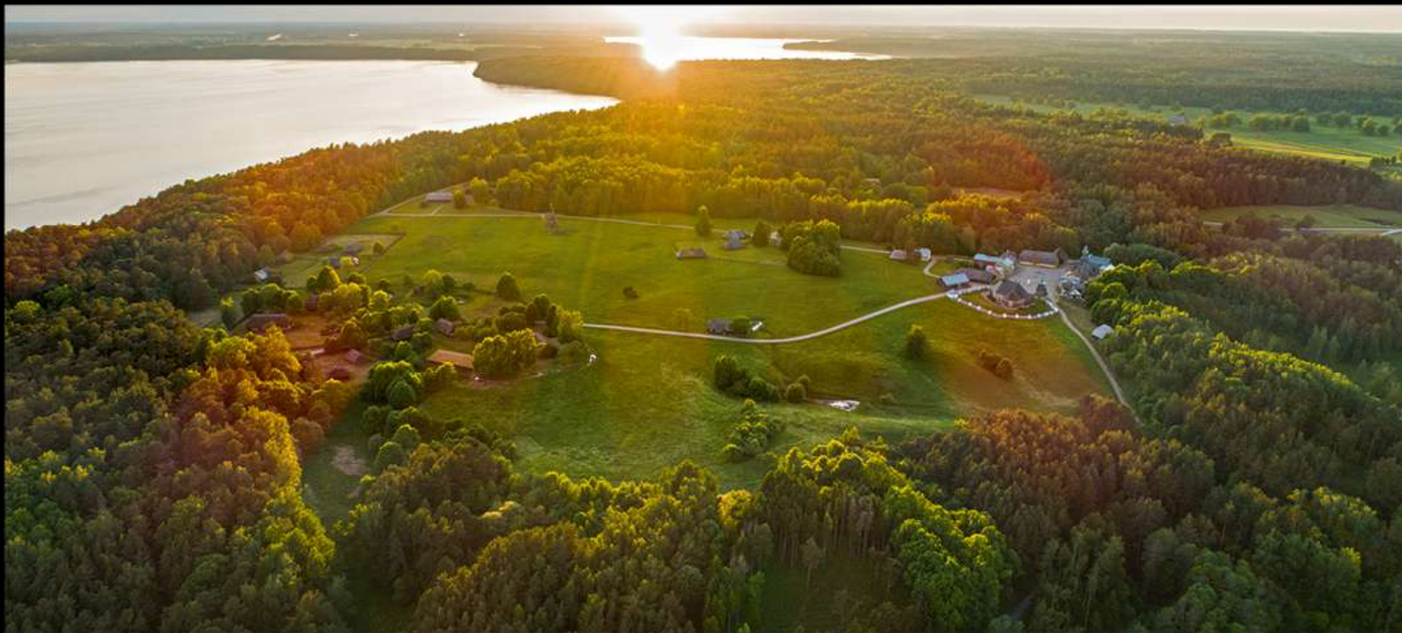
Lietuvos liaudies būdies muziejus „Tėviškė“. Vienas didžiausių etnografinių muziejų Europoje po atviru dangumi, įkurtas 1974 m. Rumšiškėse, Kauno marių pakrantėje. Muziejus užima 195 ha plotą, čia eksponuojami 138 pastatai.