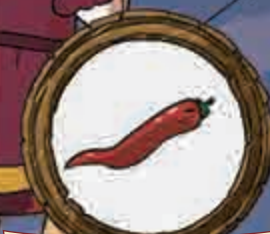
Aitrioji paprika NE